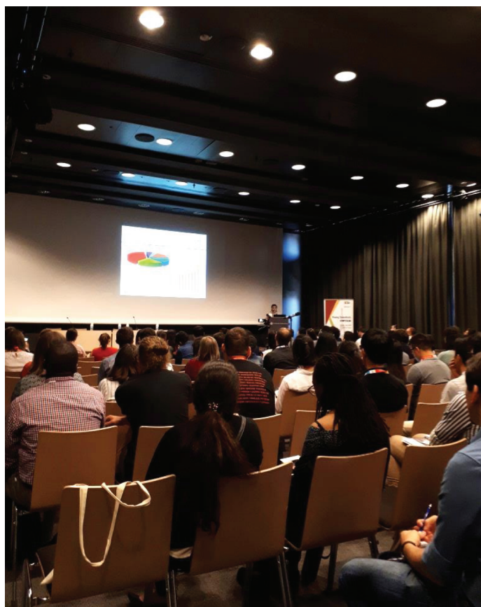
Figure 1 - Le symposium « Jeunes chimistes » au Palais des congrès.