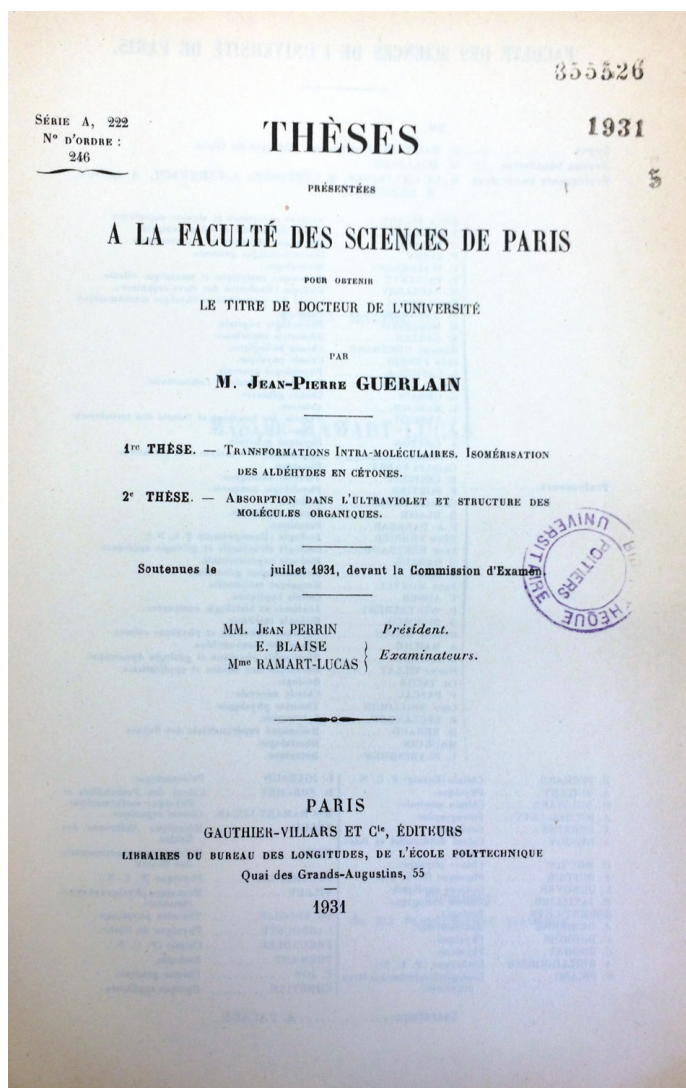
Figure 2 - Thèse de Jean-Pierre Guerlain, 1931.

minérale et de pharmacie industrielle à la Faculté de pharmacie de Montpellier de 1939 à 1970.