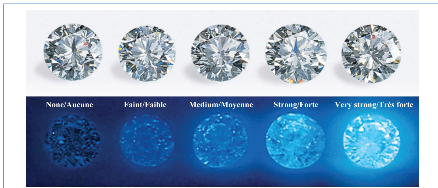
Figure 3 - Cinq diamants photographiés en lumière blanche (en haut) et sous une lampe UV (en bas) illustrant les cinq niveaux d'intensité de fluorescence. Adaptation d'un document du GIA ( https://4cs.gia.edu/en-us/blog/fact-checking-diamond-fluorescence-myths-dispelled ).

Par ailleurs, divers cas de phosphorescence de diamants ont été observés [5]. En particulier, la plupart des diamants de type Ilb – c'est-à-dire contenant des atomes de bore mais pas d'azote (voir tableau I) – présentent une phosphorescence