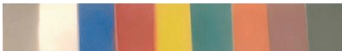
Figure 3 - Photographies du revêtement de la couche inférieure (à l'extrême gauche) et des revêtements bicouches de différentes couleurs. (Crédit : Yucan Pen et al. [4] - CC BY-NC-ND).