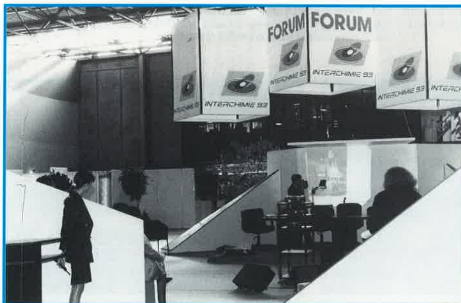
A l'espace Forum, une trentaine de nouveautés ont été présentées par les sociétés.