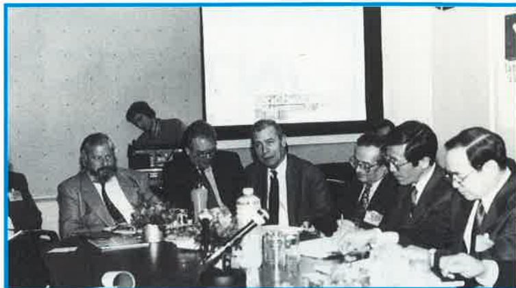
Des visiteurs (étrangers) particulièrement intéressés par toutes les innovations, mais aussi disposés à répondre à nos questions.