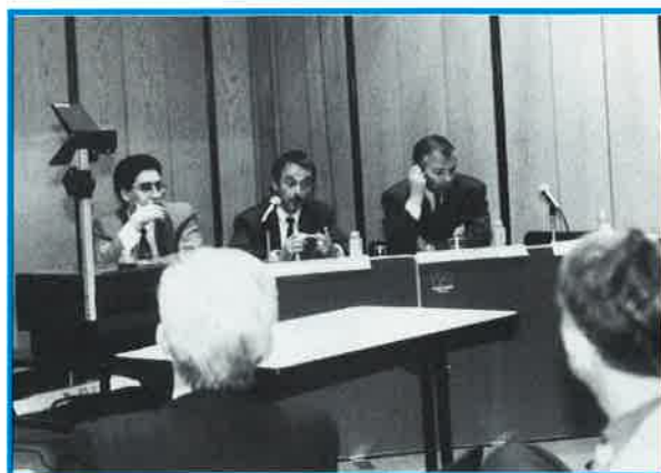
"Au Japon, nous vivons un contexte très concurrentiel. Nous venons ici en position d'acheteurs. Il est indispensable que vos produits soient bon marché, mais surtout que vous respectiez les délais de livraison !"