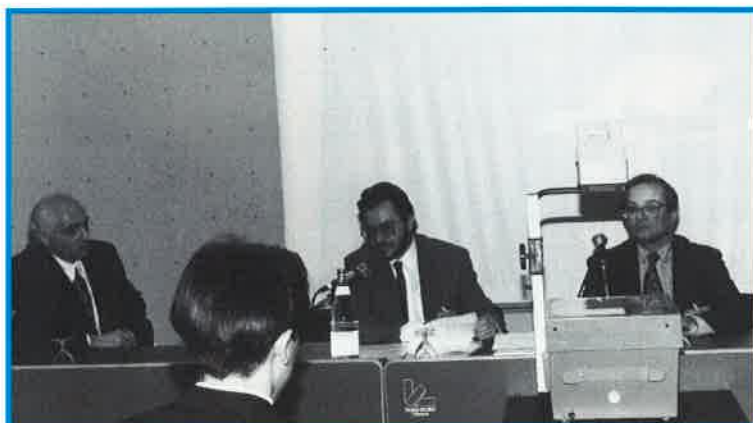
A la XVI e Conférence internationale des industries chimiques, un colloque sur la mesure et l'analyse industrielle : "Pour progresser dans la protection de l'environnement, les normes se multiplient et conduisent à des surcoûts au niveau des installations et des contrôles".