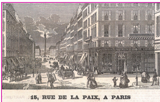
Figure 1 - Boutique Guerlain rue de la Paix (selon gravure, 1903).

chimiste et sa propension à faire de véritables cosmétiques à partir de produits à vocation initiale pharmaceutique. Il est aussi en contact avec les plus grands savants de son époque tel que Gay-Lussac. On apprend de sa plume que la Crème d'Ours Pure Liquéfiée « n'est autre que la partie purement oléagineuse de la véritable graisse d'ours privée de stéarine par un simple traitement à froid, sans alcool ni acide ». Les préparations à base de graisse d'ours sont alors très en vogue et distribuées par les pharmacies anglaises pour lutter contre la calvitie.