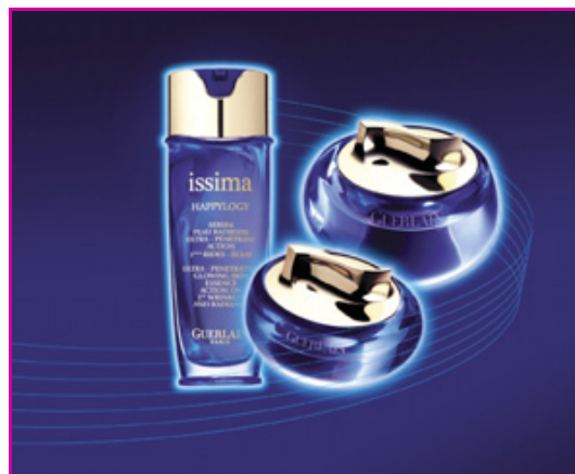
Figure 6 - Happylogy.

La recherche autour de la neurobiologie cutanée est un des axes majeurs suivis par Guerlain qui innove en lançant Happylogy , premier soin antirides majeur ouvrant le domaine de la neurocosmétique vers l'anti-âge (figure 6). La technologie Happylogy repose sur un complexe « pro-endorphines » issu de cacao et contenant des xanthines, complexe capable de stimuler la production d'une cytokératine majeure dans la différenciation de l'épiderme et aussi de stimuler les fibroblastes du derme. Ce soin est destiné aux premières rides.