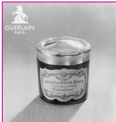
Figure 2 - Pot Secret de Bonne Femme.

stéarates alcalins avec de la stéarine, de la lessive de soude et de l'eau. Il sera remédié à leur côté sec pour l'épiderme en y ajoutant, à partir de 1900, de la glycérine. Dans les crèmes, le savon joue le rôle d'émulsifiant vis-à-vis des autres substances jusqu'en 1918, où il sera remplacé par la triéthanolamine qui forme la base des laits pour le visage, en attendant l'apparition des tensioactifs plus modernes quelques décennies plus tard.