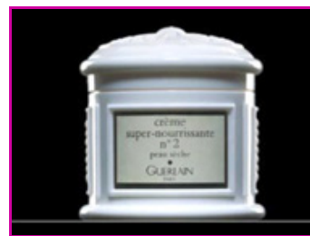
Figure 3 - Pot dit « pont aux choux ».

Véritable innovation lancée en 1980, issima est une ligne haut de gamme de produits régénérateurs à base « d'hydrolastine », destinée à lutter contre le vieillissement cutané. L'hydrolastine, complexe biologique original et exclusif créé par Guerlain, est l'association de collagène natif filmogène, d'acide lactique humectant, d'élastine hydrolysée et d'un extrait de prêle riche en silicium. Cette ligne s'enrichit en 1984 de issima démaquillant crème et en octobre 1987 du soin aquasérum . Enrichi à l'hydrolastine, ce soin hydratant est une émulsion complexe à base d'alcool stéarylique polyoxyéthyléné, de caprylic/capric/succinic triglycéride, d'isononanoate de cétéaryle, de glycols, d'huile de germe de blé, d'acide hyaluronique et de cire d'abeille. Ce soin montre des qualités d'hydratation longue durée. Très apprécié par