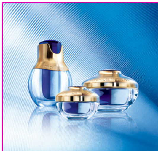
Figure 7 - Orchidée Impériale , ligne de produits.

Le développement d'un soin anti-âge global est une nécessité pour des consommatrices toujours plus exigeantes et qui recherchent dans un soin un maximum de confort et d'efficacité. La problématique de mieux comprendre le vieillissement de la peau est une constante pour les chercheurs de LVMH Recherche et Guerlain a toujours eu comme souci de garder à la peau sa longévité fonctionnelle, c'est-à-dire les fonctions d'une peau jeune. C'est donc tout naturellement que Guerlain s'est intéressé aux orchidées fleurs à la beauté fascinante, reconnues pour la longévité de leur floraison, et a créé Orchidée Impériale (figure 7). Au sein de leurs laboratoires, les équipes de recherche ont réussi à transposer le secret de cette longévité dans un soin cosmétique. Après sept ans de recherche, il a été démontré que l'association particulière de molécules provenant d'extraits de racines de quatre orchidées possédait des propriétés anti-âges exceptionnelles pour la peau. Cet extrait, dénommé « Extrait Moléculaire Orchidée Impériale », possède cinq actions anti-âge fondamentales démontrées par des tests sur cellules de peau humaine :