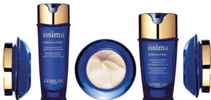
Figure 5 - Substantific.

concentrée d'acides gras insaturés, issue d'algues de la famille des chrysophycées. Des études par diffraction des rayons X ont montré que l'or bleu s'intègre au ciment lipidique intercornéocytaire pour le renforcer [17].