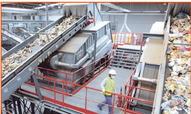
Figure 3 - Dans l'usine de Ludres, l'identification et le tri des déchets industriels banaux (DIB) sont entièrement automatisés.

dans notre vie personnelle et professionnelle. Leur valorisation peut être effectuée de plusieurs façons.