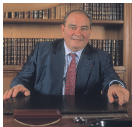
Pierre Potier.

C'est une équipe du CNRS dirigée par le pharmacien et chimiste Pierre Potier (1934-2006) qui a obtenu le taxol par hémisynthèse en partant non pas de l'écorce, mais des aiguilles (donc renouvelables), et cette fois de l'if européen ( Taxus baccata ). Le taxol est commercialisé depuis les années 1990 par le laboratoire américain BMS, sous la marque Taxol®, mais la recherche du CNRS a débouché sur un second médicament