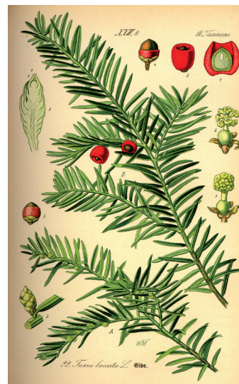
Taxus baccata , depuis Linné en 1753.

Le Taxotère® diffère du Taxol® par son groupement oxy- tert -butyle au lieu d'un phényle. Or cette différence, obtenue par hasard au cours des recherches, rend le Taxotère® plus actif dans certains cas que le Taxol®, et le suffixe de Taxotère ® a donc été choisi pour rappeler l'importance de ce groupement tert -butyle.