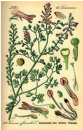
Fumeterre officinale © Wikimedia.

d'où vient en français fumeterre , attesté au XIII e siècle et emprunté par l'anglais fumitory . En allemand, la plante est nommée Erdrauch , de Erd « terre » et Rauch « fumée ». Le grand agronome Olivier de Serres en 1600 et le botaniste suisse Bauhin en 1623 nomment la plante en latin fumaria , qui est resté le nom actuel de la fumeterre en italien et en espagnol. Enfin, le nom de genre retenu par Linné en 1753 est Fumaria pour 11 espèces de fumeterres (on en connaît 50 aujourd'hui), dont Fumaria officinalis , la fumeterre officinale.