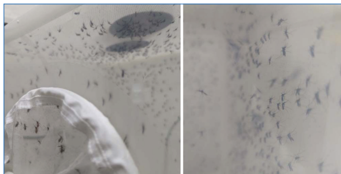
Femelles Aedes aegypti lors d'un repas sanguin.

Dans le cas d'espèces issues de flores tropicales, la démarche de caractérisation est indispensable. De nombreuses plantes issues des jardins créoles et/ou de contrées tropicales restent peu documentées sur le plan phytochimique et ethnobotanique [11]. Les données disponibles dans la littérature peuvent être fragmentaires, parfois limitées à des identifications partielles ou à des études réalisées dans d'autres contextes géographiques. Cette absence relative de référentiel impose une approche exploratoire rigoureuse.