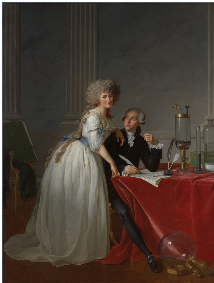
Figure 3 - Portrait d'Antoine Lavoisier et de sa femme , par Jacques-Louis David, 1788 (Metropolitan Museum of Art, New York). Le tableau, commandé par Marie-Anne, peut se lire comme le mélange programmatique des arts et des sciences et leur répartition au sein du couple au service de la nouvelle chimie.

Le laboratoire restauré, les collections exposées, les registres conservés, Madame Lavoisier peut de nouveau faire salon – et faire salon scientifique. Elle y reçoit les anciens membres du groupe de l'Arsenal, tels Laplace ou Berthollet, ainsi que de jeunes savants promis à un avenir scientifique éminent, parmi lesquels Gay-Lussac, Biot et Arago. Son rôle de gardienne de la mémoire de son mari devient alors indissociable de sa propre identité sociale et intellectuelle.